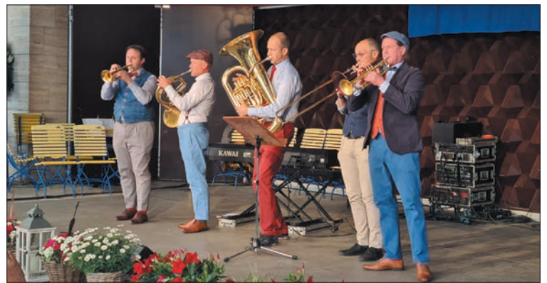
«Musik für's Herz – Musik für's Volk» – Generell5 – Blasmusik vom Feinsten – spielen im Pfarreizentrum.