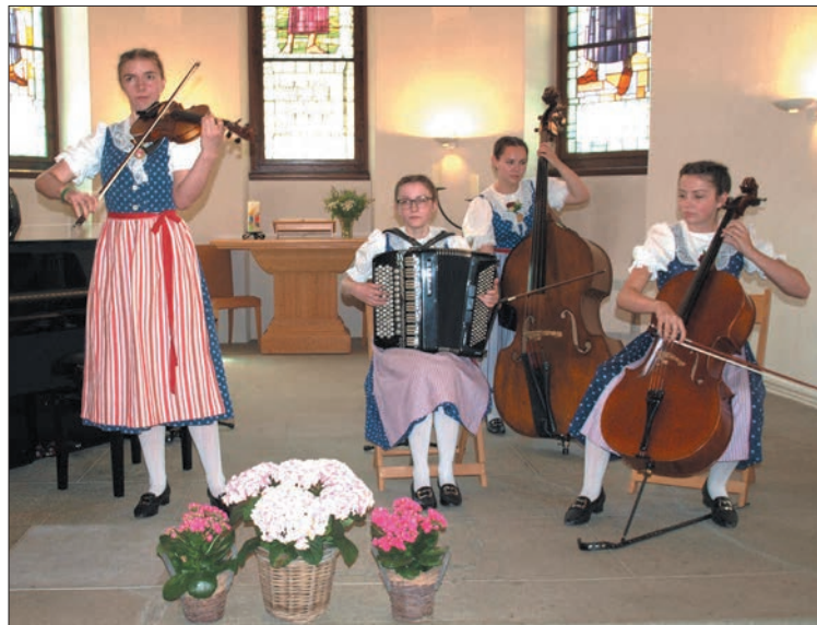
Mit ihrem frischen Auftritt begeisterte die Toggenburger Meitle Musig das Publikum bei den Nachwuchsformationen in der reformierten Kirche.