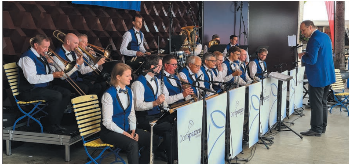
Die Blaskapelle Dorfspatzen Oberägeri sorgte mit ihrem Auftritt für grosse Begeisterung.