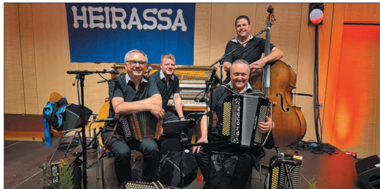
Wo das quartett waschächt auftritt, herrscht gute Laune.