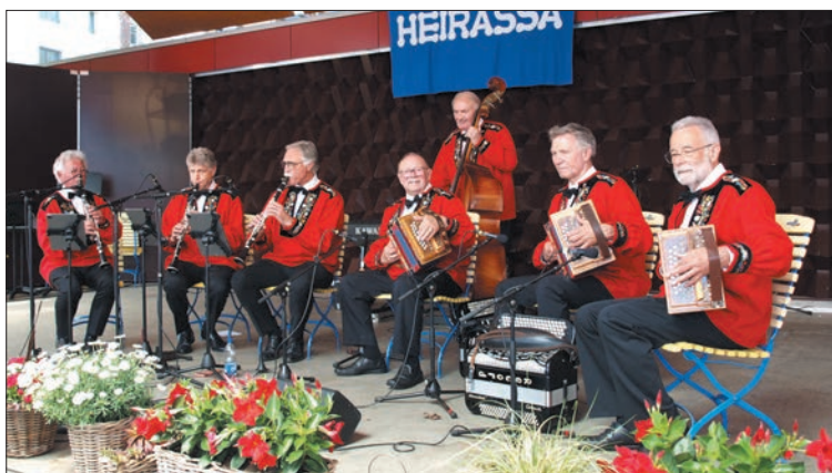
Erstmals spielte die Top-Kapelle Oberalp aus dem Bündnerland am Heirassa-Festival und reiste gleich mit einem ganzen Fanbus an.