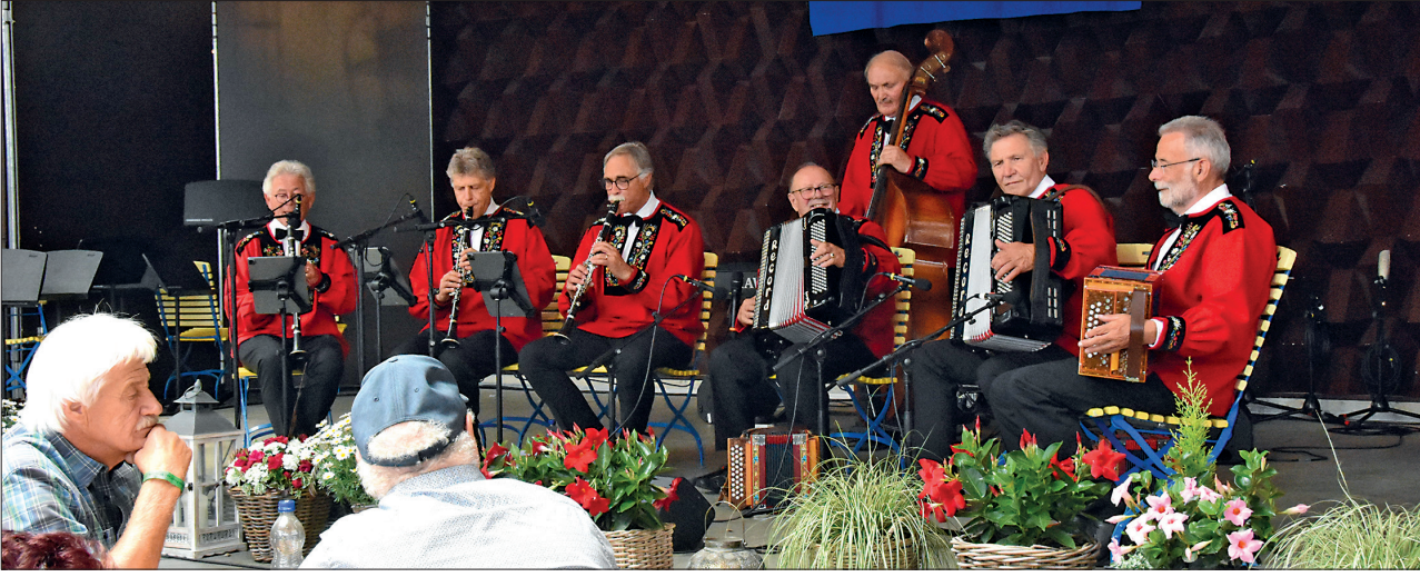
Während den vier Tagen traten 43 Formationen in verschiedenen Lokalen auf. Eine davon war die Kapelle Oberalp, die am Sonntagnachmittag im Pavillon am See aufspielte.