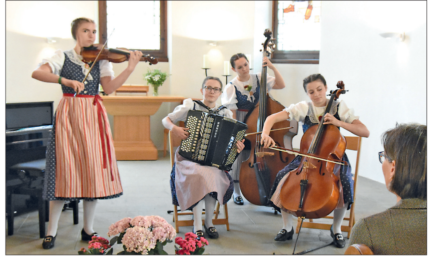
Ein wichtiger Bestandteil des Heirassa-Festivals ist die Förderung des Nachwuchses: Im Bild die Toggeburger Meitemusik in der reformierten Kirche.