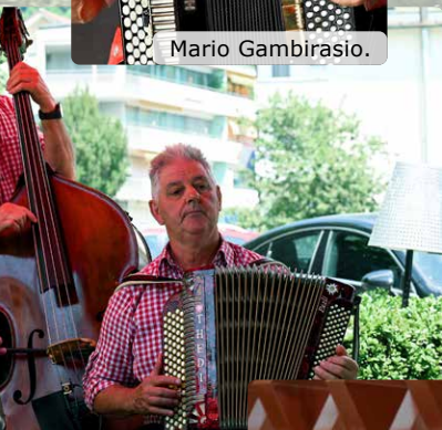
Echo vom Vitznauerstock.