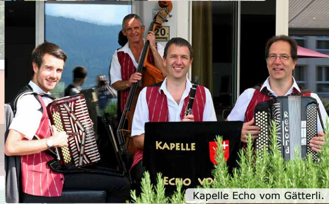
Kapelle Echo vom Gätterli.